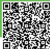
臺灣科技大學 招生專區